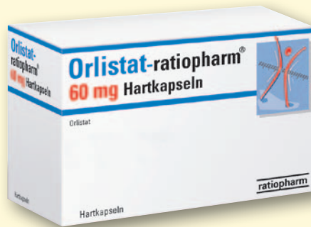
Orlistat-ratiopharm® 60 mg* 42 Hartkapseln

Freundschaftspreis € 0,99 Wir beraten Sie gerne