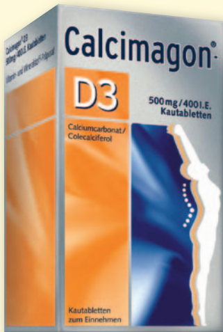
Calcimagon® D3* 112 Kautabletten

Freundschaftspreis € 29,98 Wir beraten Sie gerne