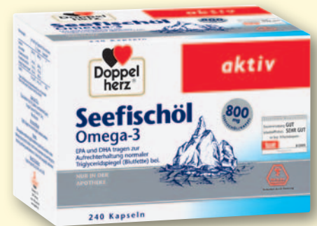
Doppelherz® Seefischöl Omega-3 800 mg 240 Kapseln

Freundschaftspreis € 6,98 Wir beraten Sie gerne