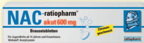
NAC-ratiopharm® akut 600 mg* 20 Brausetabletten

»Achten Sie auf weitere Angebote in unserer Apotheke!«